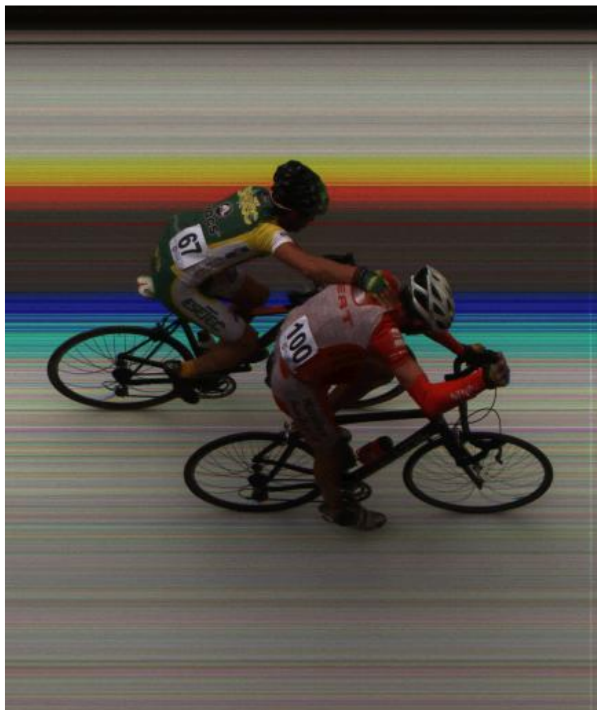
Primera Meta volante Vuelta 4